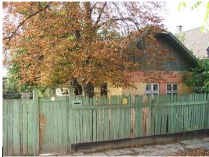
3. kép: Parasztház a Medgyesalján

oromzati szellőzőnyílás erre a korra jellemző, ovális alakú. A ház sajnos rossz, de nem menthetetlen állapotban van, s átépítetlenül, eredeti állapotában, egyedül megmaradt emléke korának. Szintén város széle volt ezzel egyidőben a Fábián kapu környéke is. Itt, a mai Dózsa György úton , szinte minden ház átépült, de a 7. sz alatti ház még őriz XVIII. századi elemeket.