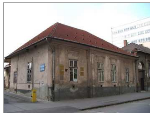
2. kép: Dózsa Gy. u. 7. sz.

Hunyadi utca 62. sz. alatti lakóház. Az épület nem igazán parasztház, inkább módosabb, kismemesi, vagy polgári lakóház. Az épület ma is áll, s érdekessége, hogy jelenleg is az építető leszármazottainak a tulajdonában van. Az épület téglafalazatú, míves, deszkaborítású vakolatarchitektúrája későbarokk