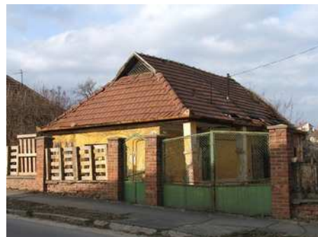
4. kép: Parasztház a Feszty Árpád utcában

Az első világháború idején nyugaton a Meggyesalja környéke, északon a Bábonyi-bérc alja jelentette a belterület határát. Utóbbinál, a mai