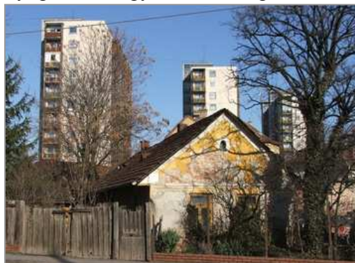
1. kép: Hunyadi u. 62. sz.

A XVIII. században a Hunyadi (vagy másként Nagy-Hunyad) utca nyugati, Diósgyőr felőli vége a város szélének számított. (A Győri kapu valahol a Dayka utca vonalában állhatott.) Itt épült, a mestergerendába vésett évszám szerint az 1770-es években, a mai