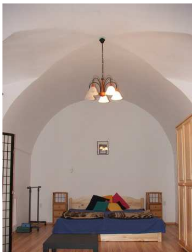
5. kép: Kisbíró-ház boltozata, Petőfi u. 31.

A Petőfi utca egykoron az Urak utcája volt. Több ház is őriz XVIII. századi részletet. A 31. sz. alatti eklektikus épületbe, a „hajlított” utcai szárny építéskor egyszerűen belefoglalták a XVIII. század végi boltozatos későbarokk lakóházat, amely az ott lakók „legendáriuma” szerint egykoron a miskolci kisbíró háza volt. A Petőfi utca házsora minden bizonnyal még számos érdekességet rejt, vizsgálata, felmérése feltétlenül fontos lenne.