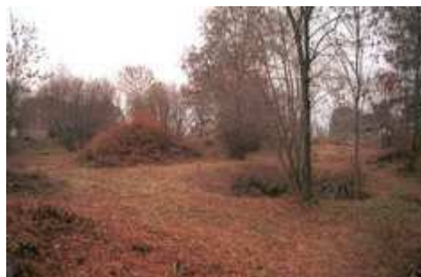
A kitisztított várudvar

Magyarország méltatlanul elfeledett várainak egyike Szádvár. A mai határszélen, az Aggteleki-karszt 460 méter magas csúcsát koronázzák a nagy kiterjedésű vár romjai, melyet alig egy évtized alatt sűrűn ellepett a bozót, az évszázados falakat benőtték a fák, bokrok. A sokáig áthatolhatatlan, beláthatatlan terület végre újra bejárható, köszönhetően a 2006. őszén végzett munkálatoknak. A példaértékű nagy vártakarítás különlegessége, hogy kezdeményezői amatőr várbarátok, akik saját munkájukat is adták Szádvár kitisztításához.