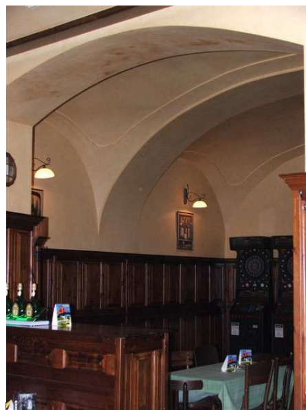
6. kép: Korábbi lakóház boltozata a Borsodi Sörözőben